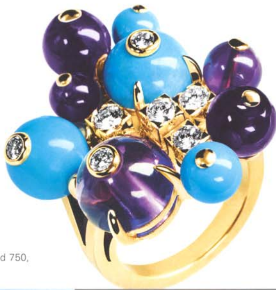
Cartier, Ring in Gelbgold mit Amethysten und Brillanten