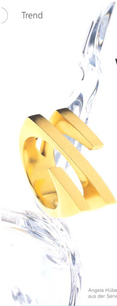
Angela Hübel, Gold 750, aus der Serie Trio